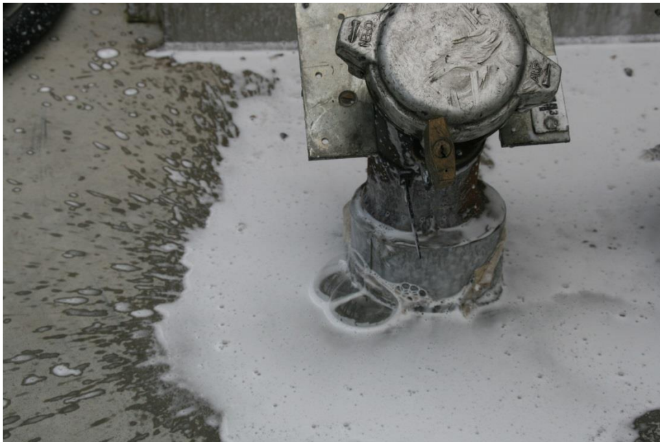
Foto: Luchtlekkage bij doorvoer.

Doorvoeren De DI beoordeelt bij doorvoeren in de voorziening, of vloeistoffen langs of door de doorvoeren – eventueel voorzien van een afdichting met voegvullingsmassa of een pakking – de niet-belaste zijde of bodem hebben bereikt en niet kunnen bereiken.