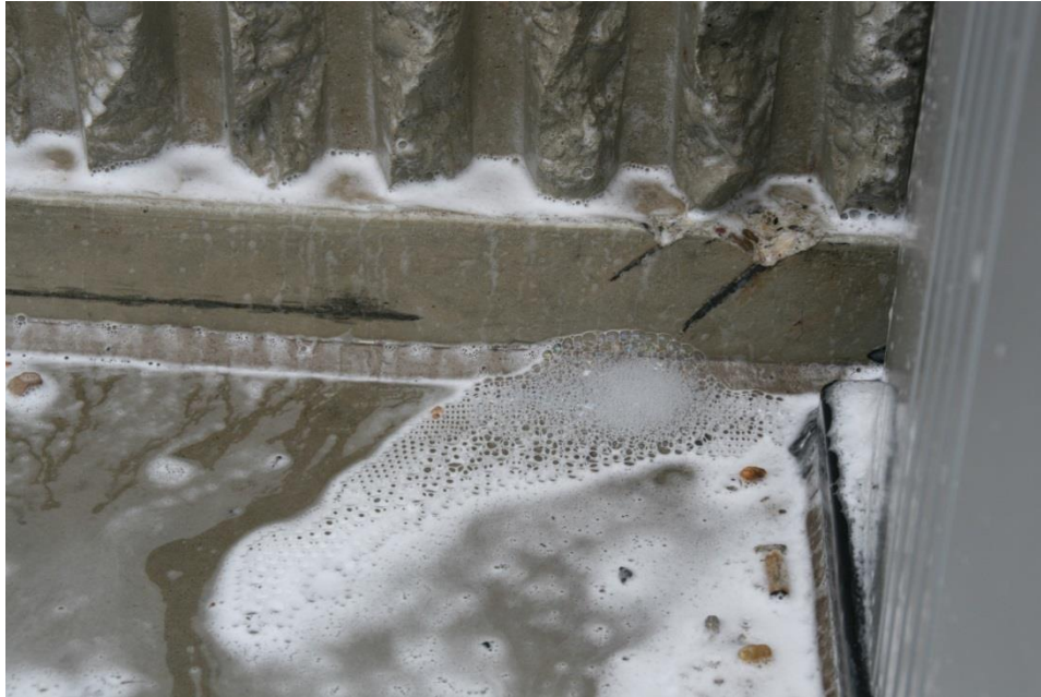
Foto: Luchtlekkage bij aansluiting.