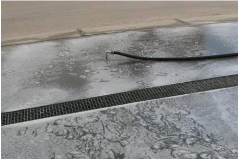
Foto: Voorbeeld van luchtinbrengpunt.

De hoeveelheid en overdruk van lucht moeten ook op de apparatuur waarmee de lucht wordt getransporteerd worden aangetoond en geregistreerd.